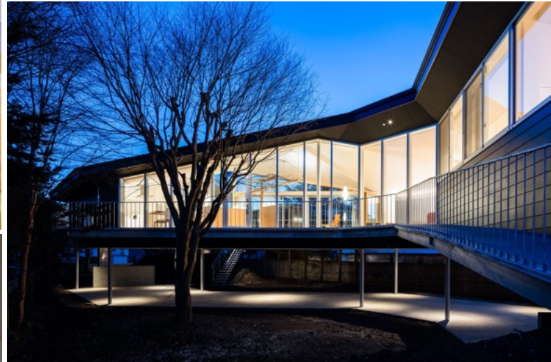
★1階はカーポートになっているので、夏の日差しも気にせずにとめられます★