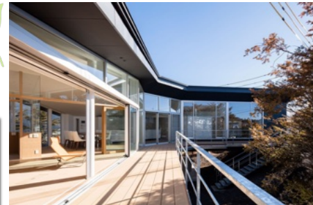
★軽井沢は好きだけど、虫が苦手な方に最適な物件です★

間取りは主寝室・個室・リビング ダイニングキッチン・和室・インナーテラスがあります