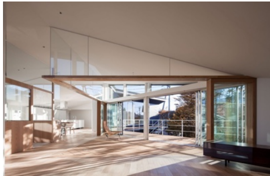
★リビングから繋がるインナーテラスには暑い日でも涼しい風が通り抜けます★